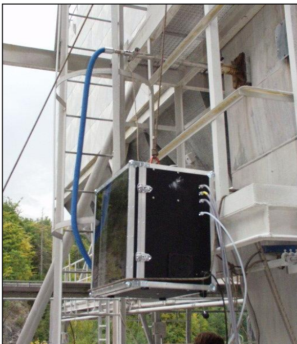
Odběr vzorku z potrubí do manifoldu vzorkovače