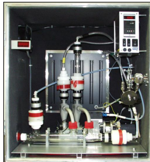
Detail třídících prvků aparatury VAPS (E)

Odebrané vzorky je možné následně analyzovat pro stanovení následujících látek: