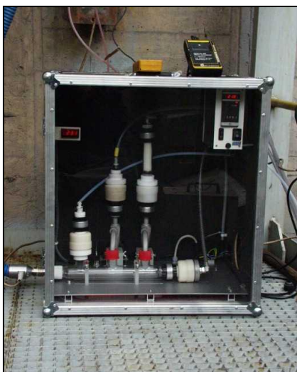
Temperovaný manifold s třídícími prvky