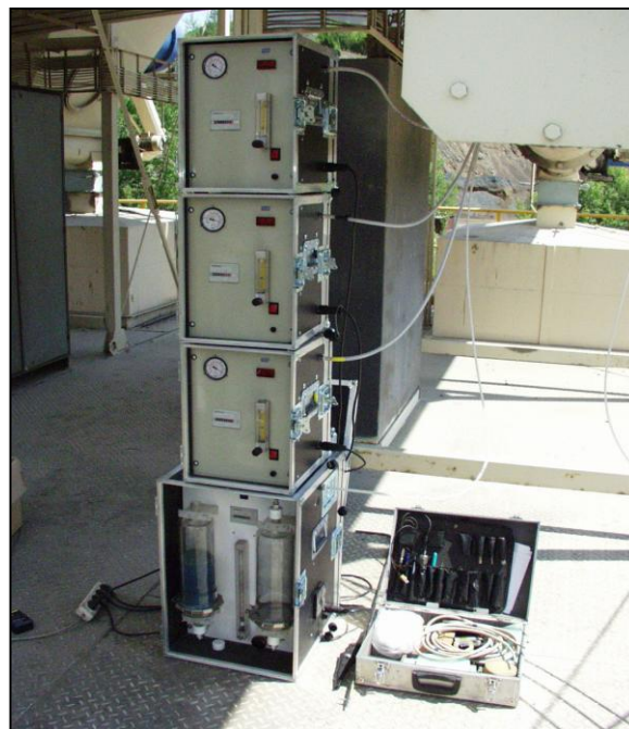
Jednotky odběru vzorků a přípravy ředícího vzduchu