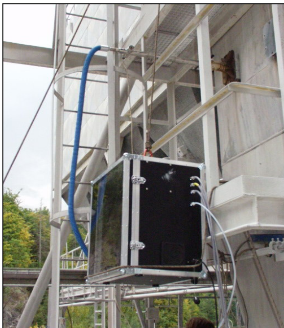
Odběr vzorku z potrubí do manifoldu vzorkovače