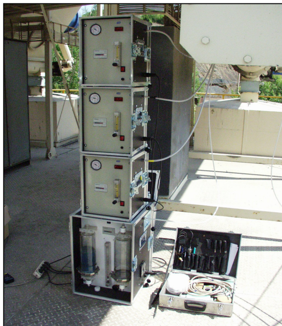
Jednotky odběru vzorků a přípravy ředícího vzduchu