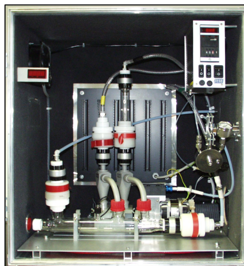
Detail třídících prvků aparatury VAPS (E)

Odebrané vzorky je možné následně analyzovat pro stanovení následujících látek: